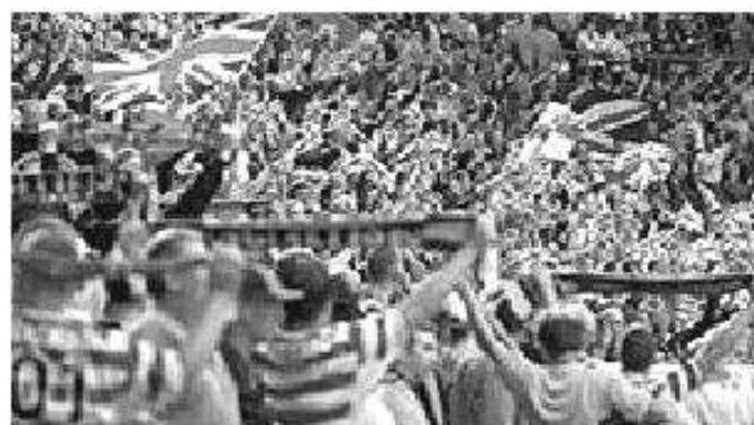
E N G L A N D