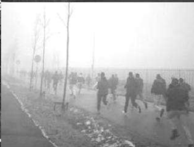
I T A L Y