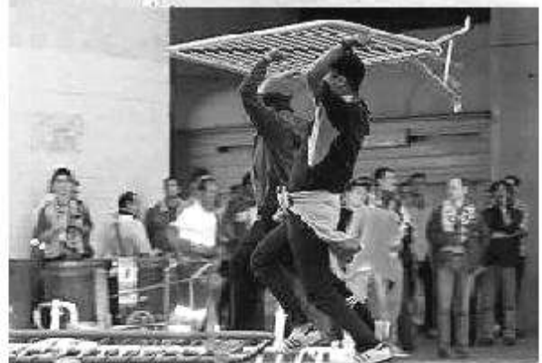
S P A I N