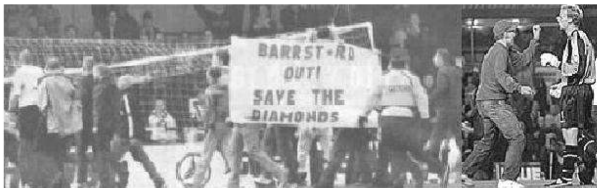
S C O T L A N D