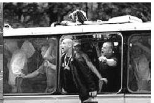
H O L L A N D