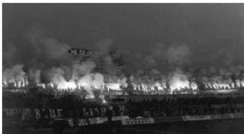
C R O A T I A