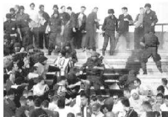
S E R B I A