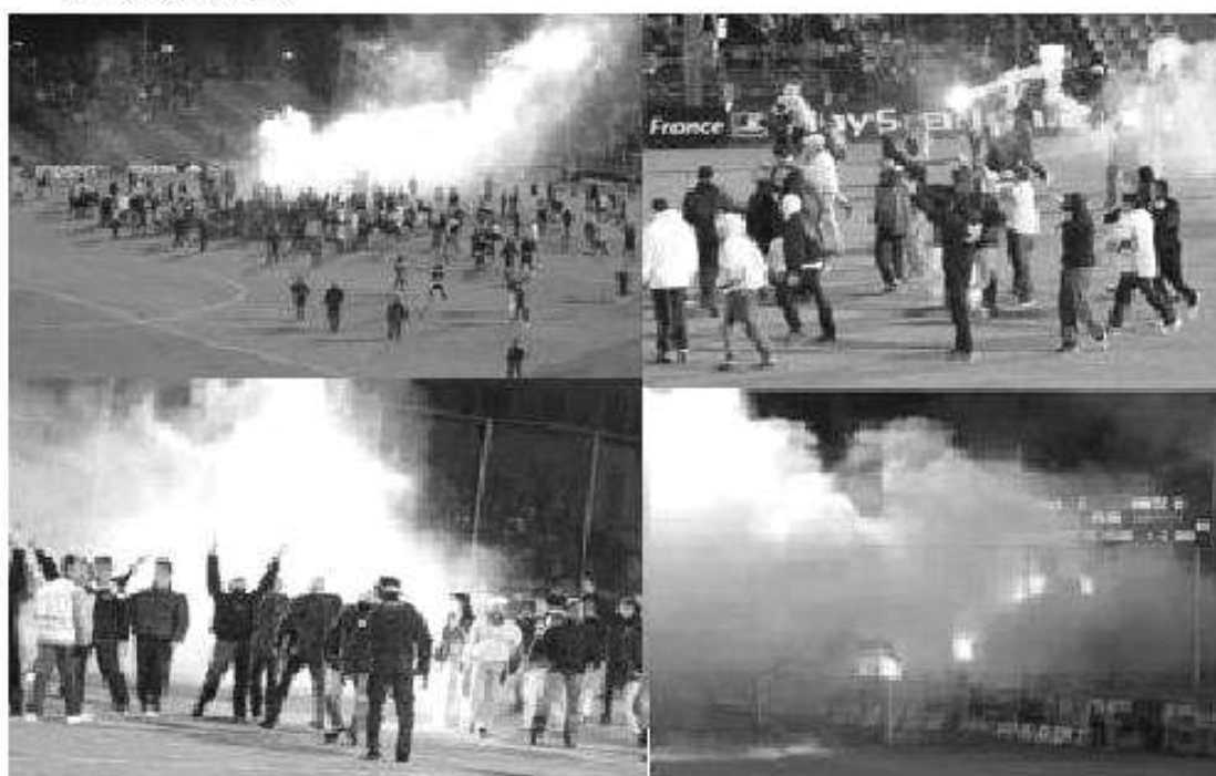
F R A N C E