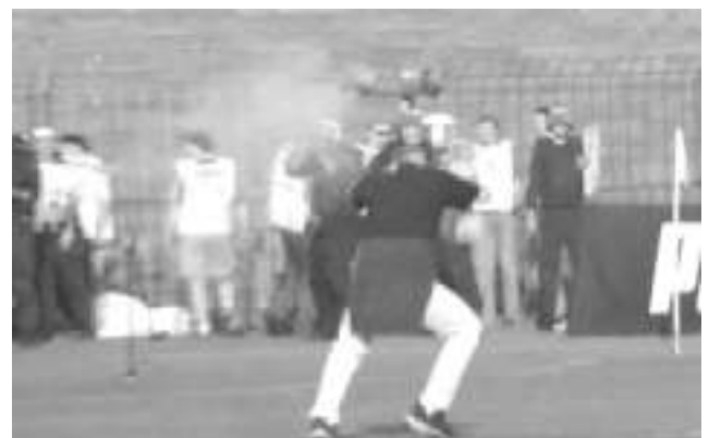
P O L A N D