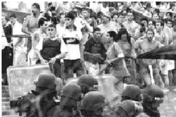
B R A Z I L