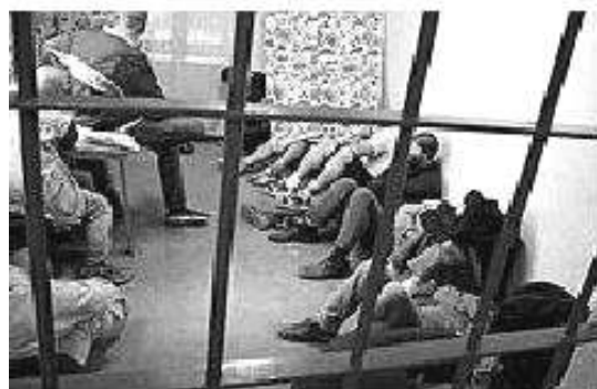
C Z E C H I A